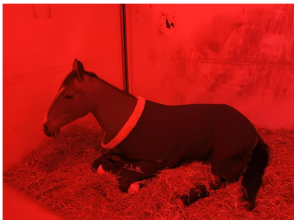
Cheval en phase de récupération

Une grande première en France et à l'international a été testée au Jump'Est Nancy-Rosières : l'installation par la société HEALF (nouveau partenaire-distributeur de Proximal depuis avril 2023) de 3 boxes témoins de la solution PROXI-PERFORM pour diffuser dans le box une lumière blanche (stimulante) ou une lumière rouge (apaisante).